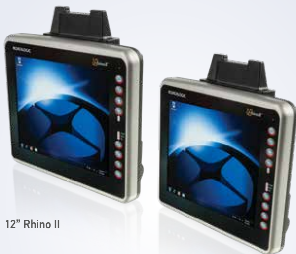
12" Rhino II